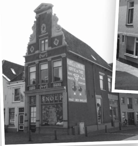
Winnaar 2012 Categorie Zakelijk: Graafschap 28