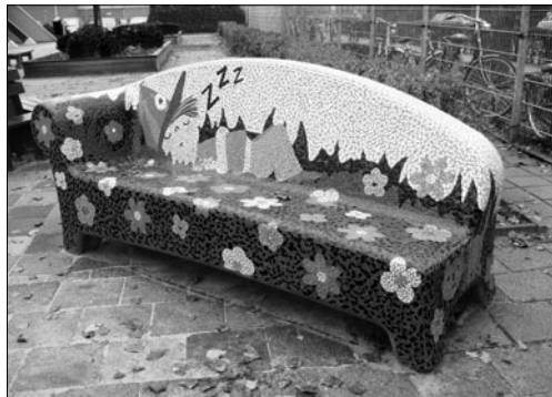
Voorbeeld van een Social Sofa bij basisschool De Pettefet in Tilburg

Het idee voor deze bank is ontstaan nadat er in de Tilburgse politiek werd gesproken over de sociale verkillig waaraan steden ten prooi lijken te vallen. Het project wil mensen op een actieve manier met elkaar verbinden, met als doel een gezamenlijke verantwoordelijkheid te dragen