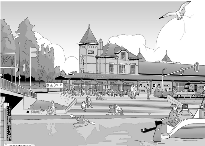
Sfeerimpressie waarin enkele ideeën zijn samengebracht.